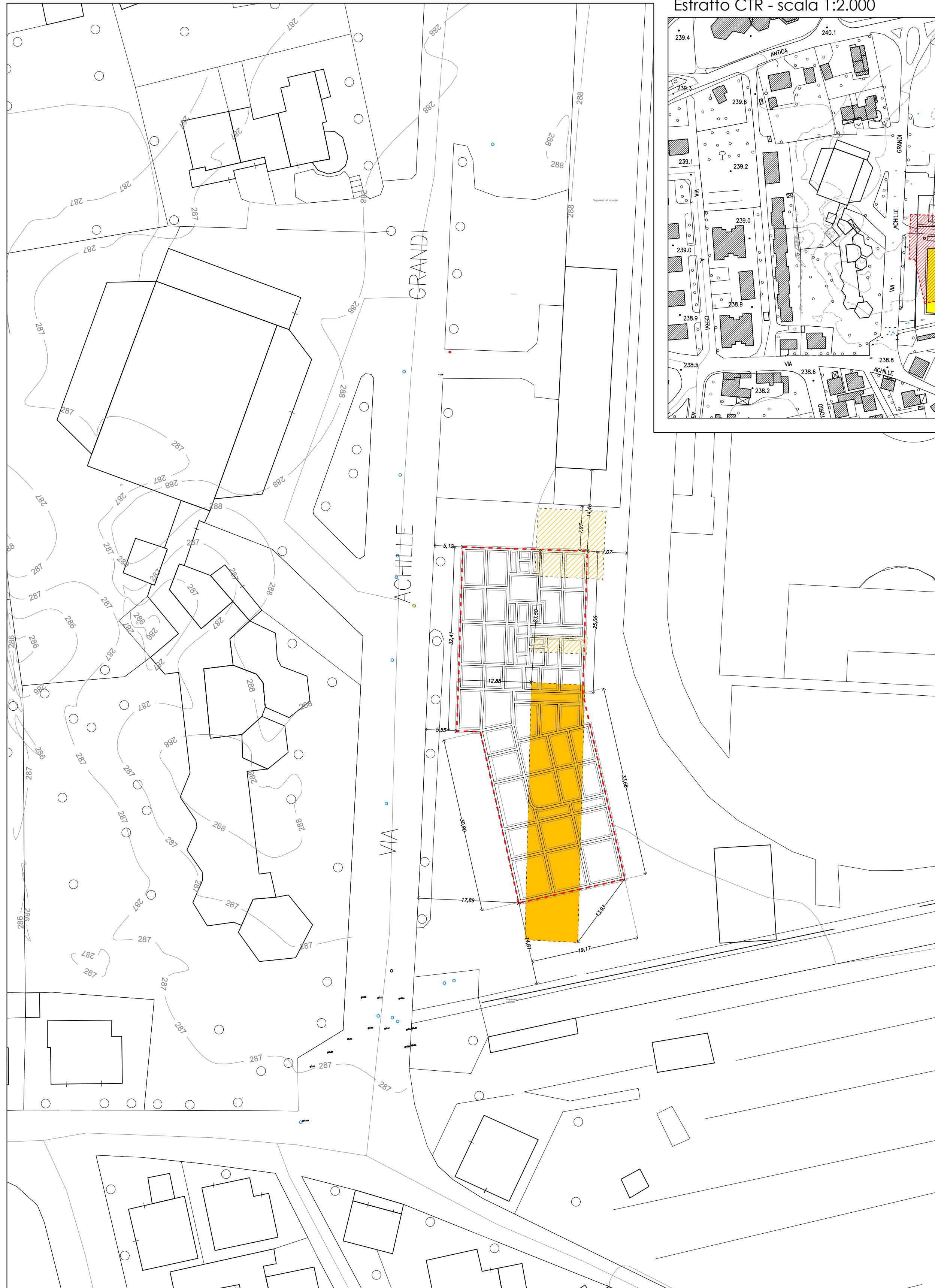
Estratto CTR - scala 1:2.000